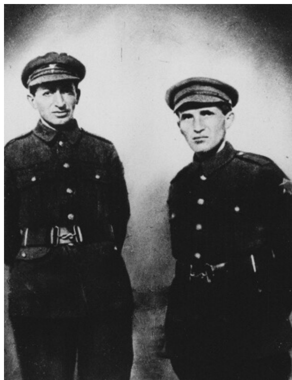
בן-גוריון עם חברו בגדוד העברי, 1918-1919