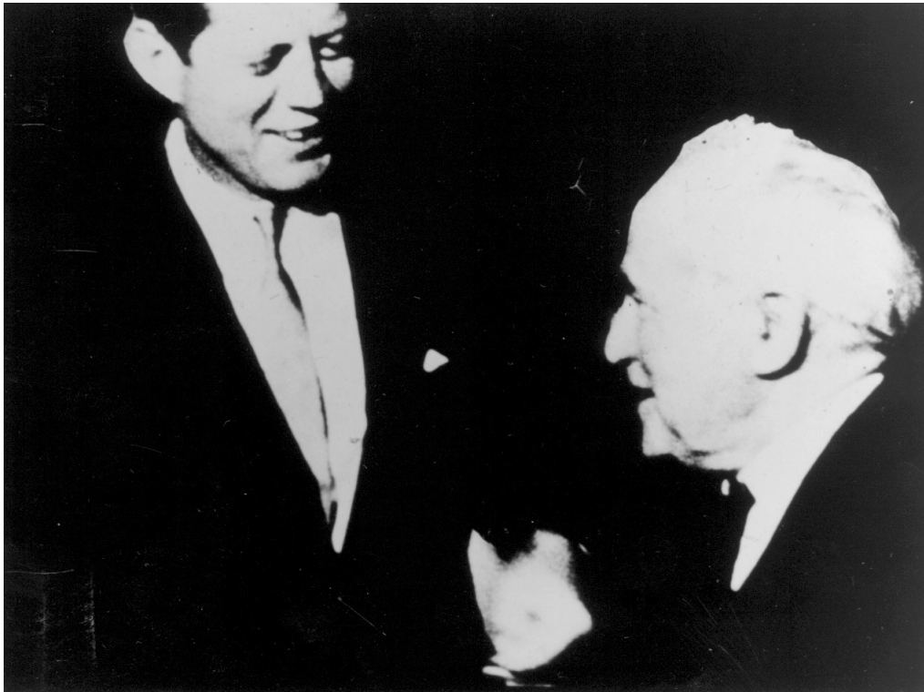
בן-גוריון עם נשיא ארצות הברית ג'ון קנדי (1961)