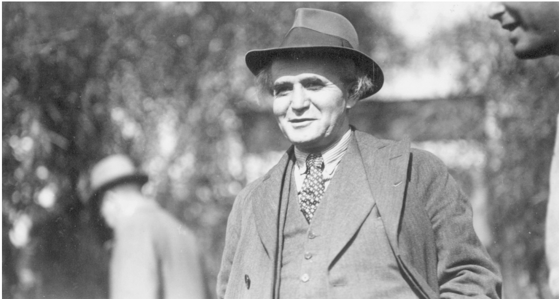
בן-גוריון בשנות ה-30