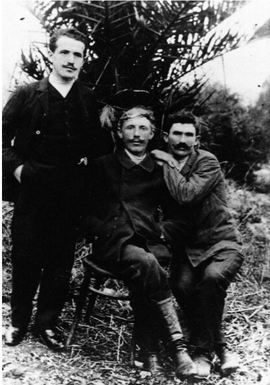
בן-גוריון עם חברים (שנות ה-20)