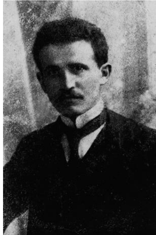
בן-גוריון בצעירותו (1905 בקירוב)