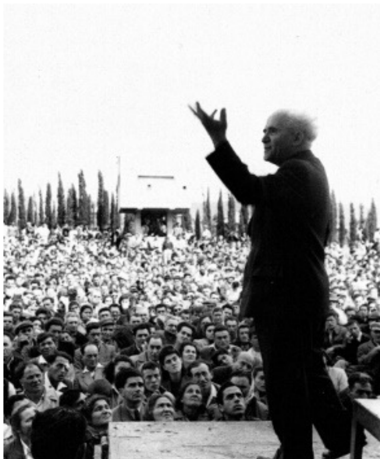
בן-גוריון נואם בחיפה (1949)