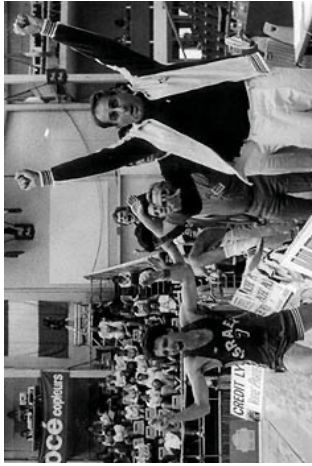
הניצחון ההיסטורי על צסק"א

” בזכות זה הייתי אחרי תקופה קצרה שחקן בחמישייה, הפכתי לקפטן, וגם שיחקתי בנבחרת. הכול בגלל שרציתי להוכיח להם. בסוף הקריירה שלי כשחקן, כשהיושע רוזין אמר לי שבעונה הבאה הוא יושיב אותי על הספסל, החלטתי להיות מאמן. ואז אמרתי לעצמי, 'אני אהיה המאמן הכי טוב בארץ.'