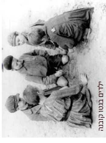
ילדים בגטו קובנה

בשנת 1936 נולד בקובנה שבליטא אריק בריק, בן יחיד להוריו הירש וליבה, עורך דין ומורה. כשכבשו הנאצים את קובנה המשפחה הועברה, עם שאר יהודי העיר להתגורר בגטו קובנה. כך סיפר על חייו בתקופת השואה: