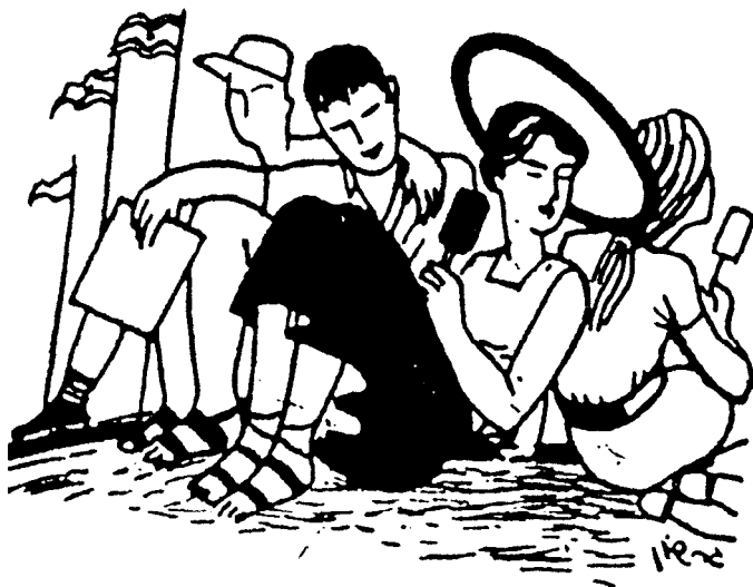
במחנה גדנ"ע, תמוז תשי"ד