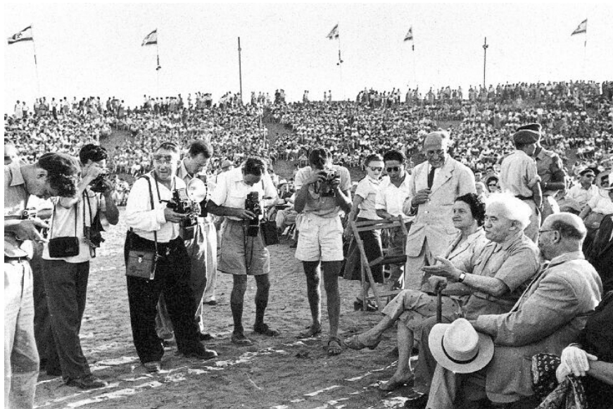
בן-גוריון ופולה בכנס שיך מוניס, 10.6.1954

ממתן פתרונות פיזיים למחייה במולדת החדשה. באותה עת נוצרו שתי קבוצות אזרחים, ותיקים ועולים, בעוד המוסדות השונים אינם מצליחים לתת מענה לצורך בשילוב הקבוצות. זהו הרקע לפניית בן-גוריון לבני הדור הצעיר כגורמים 'חוץ מוסדיים' העשויים לתת מענה ל'בעיות השעה', וכמי שמסוגלים להוביל את השינוי המתבקש לאור המציאות הביטחונית הרעועה באזורי הספר ולנוכח השסעים החברתיים-תרבותיים המחייבים פתרון. 14